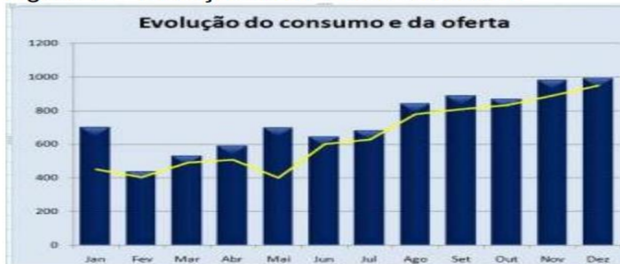
Figura 13 - Evolução do consumo e da oferta

Rodapé das figuras: Fonte Arial, tamanho 10, espaço entrelinhas simples(1cm)