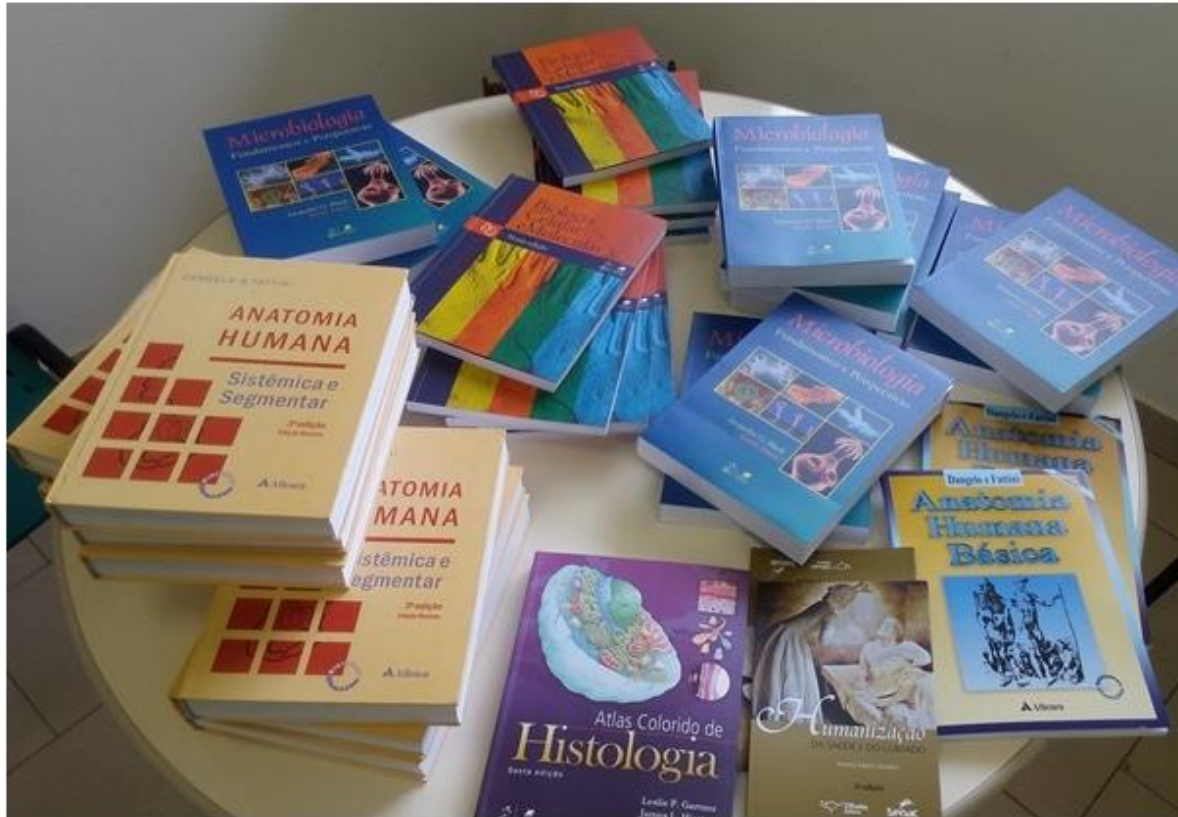
Figura 01 – Aquisição de livros Biblioteca FAEF