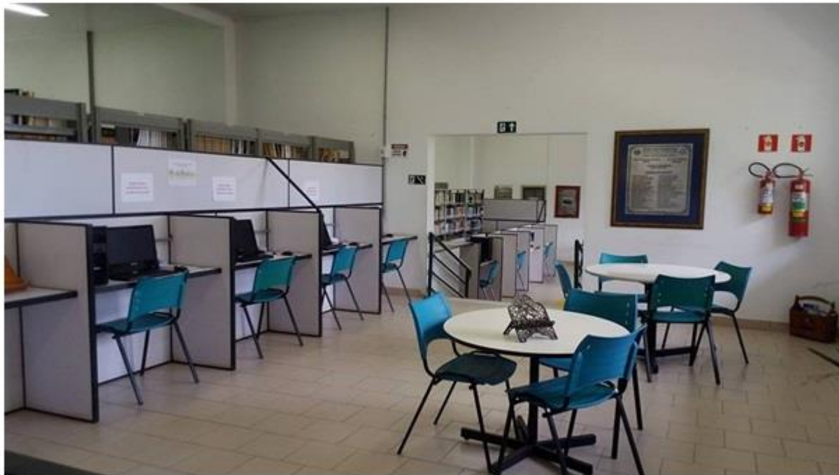
Figura 3. Biblioteca FAEF